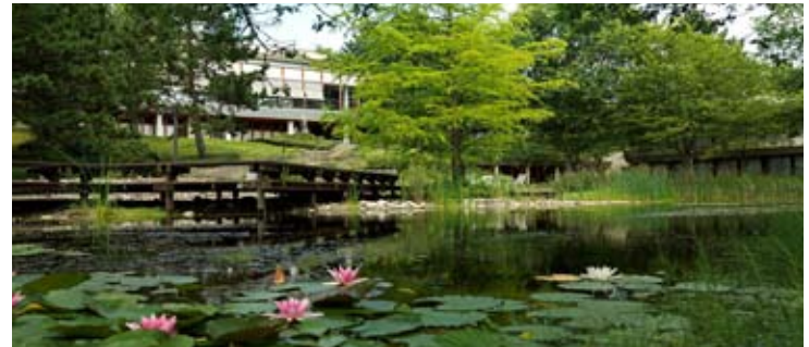
Veranstaltungsort: Kommunikations- & Trainings-Center Königstein